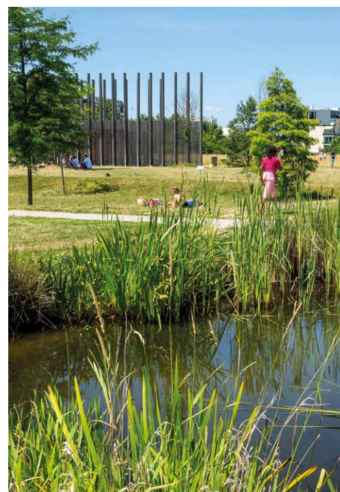
Le Parc des Impressionnistes à 7 min* à pied

Clichy est également desservie par la ligne L du Transilien et attend l'arrivée prochaine de la ligne 14'.