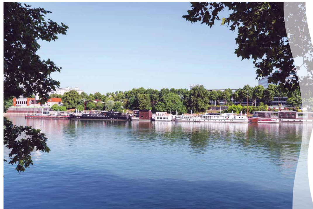
Les bords de Seine à 5 min* à pied