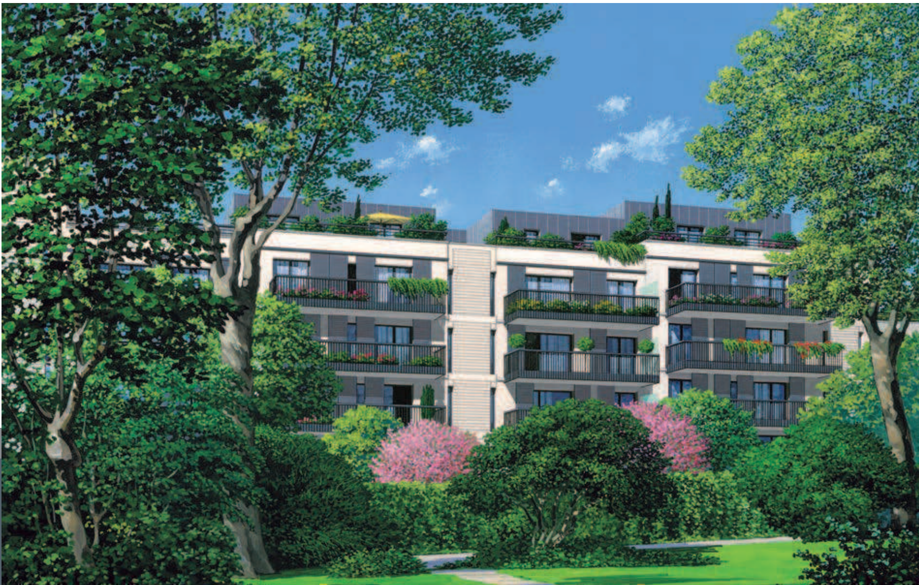
La façade du Sud-ouest, vue depuis le jardin de la copropriété voisine